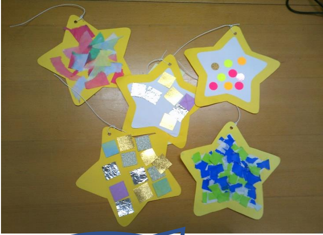
シールやのりで ペタペタ・・・ カラフルな星飾りが できました☆