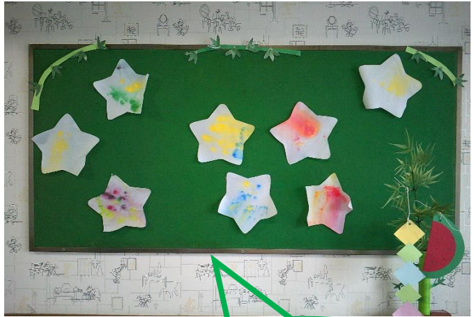
ペンで模様を描いてから 霧吹きでシュッシュ！ にじみ絵の星飾り☆